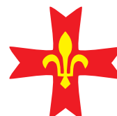
Guides et Scouts d'Europe